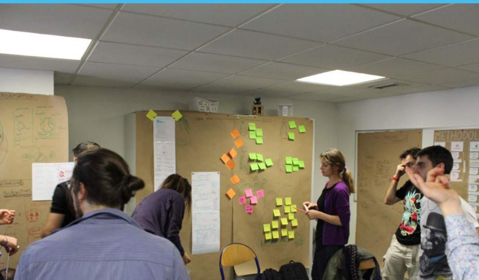
Brainstorming sur la problématique de l'emploi et de la formation en partenariat avec la 27 ème Région. Mars - Juin 2012.

Le design de service met en valeur et facilite les relations et les interactions humaines entre bénéficiaires ou/et fournisseurs concevant des outils médiatiques.